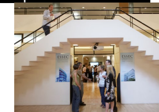
Le campus de La Défense

Dans le célèbre bâtiment du CNIT, ce campus est spécialement dédié à nos programmes de formation continue. Avec sa situation géographique exceptionnelle, ses espaces pour le travail en groupe, sa connectivité, ses lieux de vie, de lecture et d'échange, il offre les meilleures conditions de formation aux cadres et dirigeants.