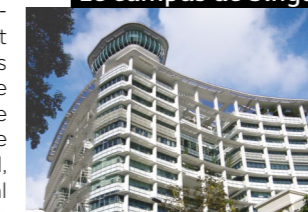
Le campus de Singapour

Singapour a toujours été aux avant-postes du développement asiatique et continue d'attirer les multinationales du monde entier. Depuis 2005, le troisième campus de l'ESSEC plonge ses étudiants au cœur d'un formidable carrefour économique, commercial, financier, avec un point de vue idéal pour appréhender les forces, la complexité, la diversité et les défis d'une région clé du XXI e siècle.