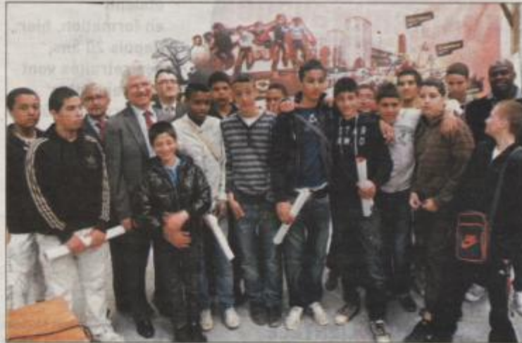
Après avoir travaillé depuis octobre 2010 sur une exposition photo retraçant la vie et l'âme de leur quartier, plusieurs jeunes de Ponta ont pu présenter leur travail, hier, aux élus et représentants de BMH.

Après l'inauguration des nouveaux locaux de l'îlot mairie, la délégation s'est rendue dans le grand hall jouxtant la résidence pour découvrir l'expo photo, réalisée par des ados du quartier.