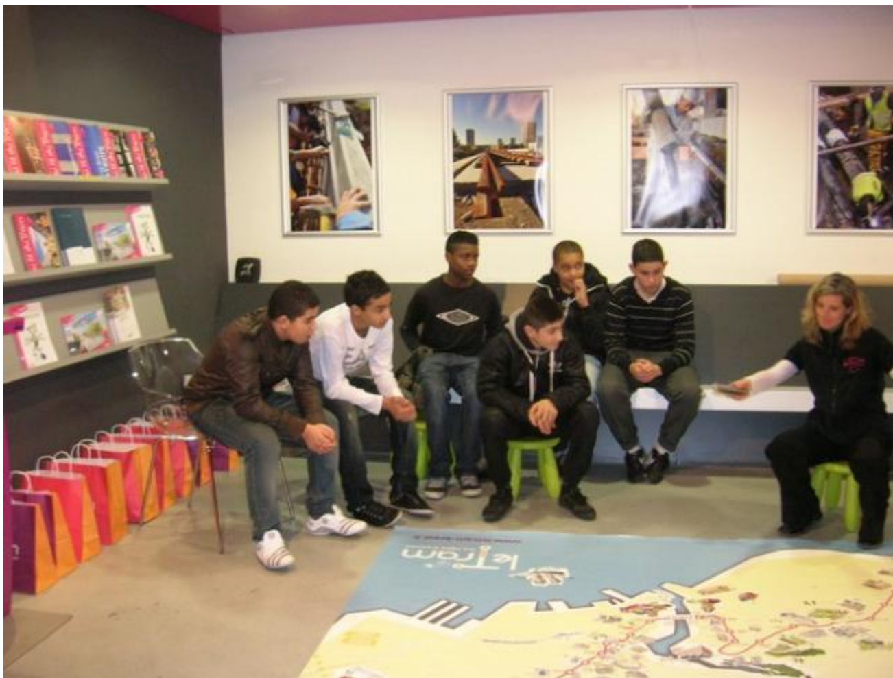
Visite de l'espace Tram de Brest