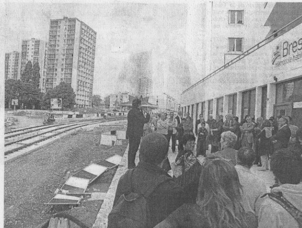
Moins de tours, bientôt un tramway et des petites résidences collectives, le quartier de Pontanézen change de visage pour mieux s'ouvrir sur le reste de la ville.