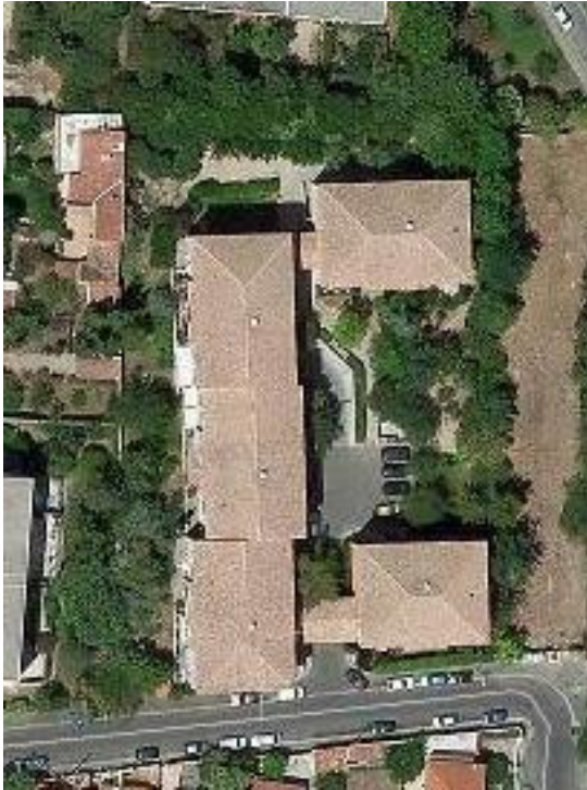
Les Trouvères 57 logements