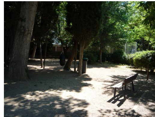
Arrière plus à l'ombre