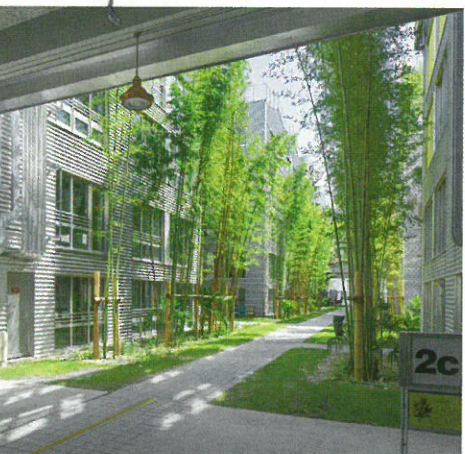
ARNAULD DUBOIS FRESNEY